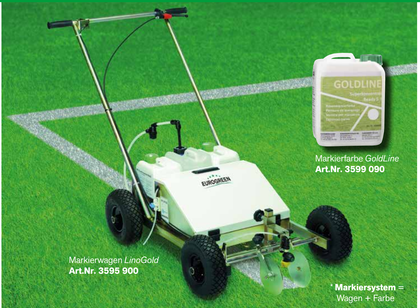
Markierwagen LinoGold Art.Nr. 3595 900